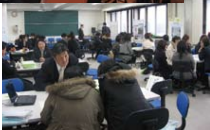
医学部保健学科主催 『合同企業説明会』の風景 → 医療関係66施設にお集まり いただきました。