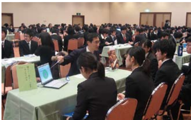
↑「合同企業説明会」の風景 (会場：ニューシティ弘前) 204社の企業にお集まりいただきました。

2月12・13日ベストウェスタンホテルニューシティ弘前を会場に、弘前大学主催「合同企業説明会」が開催されました。県内外204社の企業採用で担当者の方々にお集まりいただきました。学生も2日間でのべ950名が参加しました。2月11日には医学部保健学科主催で医療関係のみの説明会が本町校舎で開催されました。