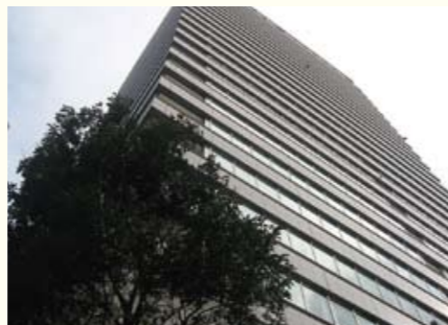
東北電力本店ビル。仙台駅から徒歩10分の場所にあります。

小学校から野球をやっていたので、野球サークルにも所属していました。先輩達が立ち上げたばかりのサークルで、まだ4年生はいませんでした。その後メンバーは増えて卒業する時には30名ぐらいになっていました。私は宴会部長です。