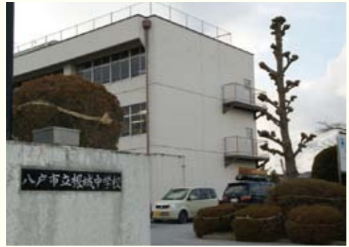
根城中学校。グラウンドでは野球部の生徒たちが練習をしていました。

●これまでのお仕事について教えてください。 大学を卒業して13年経ちます。1年目は八戸市内の中学校で講師をしました。その年の採用試験に合格して、階上町立道仏中学校で3年勤務した後、この根城中学校に来ました。理科を教えています。この中学校で6年勤務し、昨年と一昨年は、青森市にある「青森県総合学校教育センター」で務め、戻ってきて1年です。 社会人1年目の講師は辛かったです