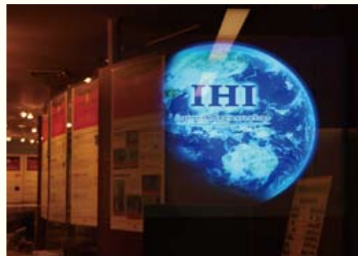
横浜事業所内の展示室。色々な技術が世界の幅広い分野で活かされています。

ロボット工学や制御を研究していました。学部の研究は3年生の後半から始まりますが、実際は4年生からが本番。ロボットの研究室に入りましたが、1年では短いなと思い、大学院の知能機械システム工学専攻に進学しました。研究と学会で忙しかったです。