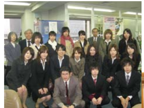
↑弘前大学東京事務所前で集合。事務所の窓から東京駅が見下ろせます。