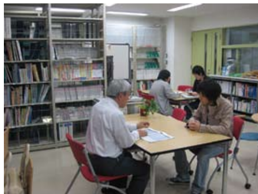
↑学生就職支援センター のようす

総合教育棟1階にある学生就職支援センターに立ち寄ってみてください。センターには企業から頂いた求人票や会社資料の他、教員・公務員採用試験、先輩の就職活動報告書などの資料もあります。