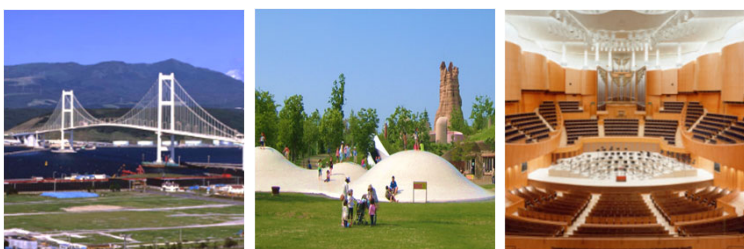
(写真:業務事例 / 左から 白鳥大橋、国営滝野すずらん丘陵公園、札幌コンサートホールKitara)